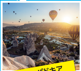
○ッパドキア (トルコ)