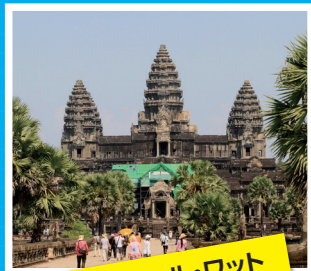
アンコール・ワット (○ンボジア)