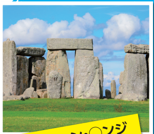
ストーン・○ンジ (イギ○ス)