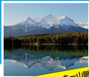
カ○ディアン・ロッキー山脈 自然公園群 (カナダ)